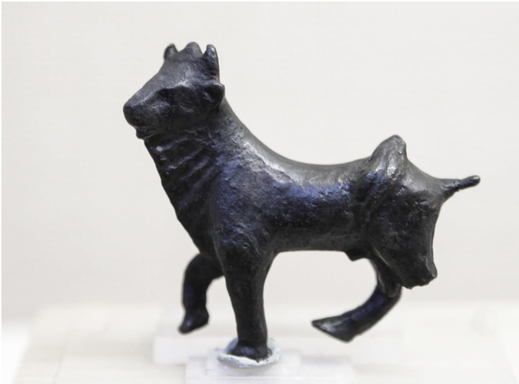
Doc 9 : taureau tricornu

En quoi présente-t-elle un caractère exceptionnel à Plassac ?