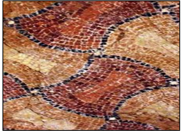
doc 5 mosaïque polychrome