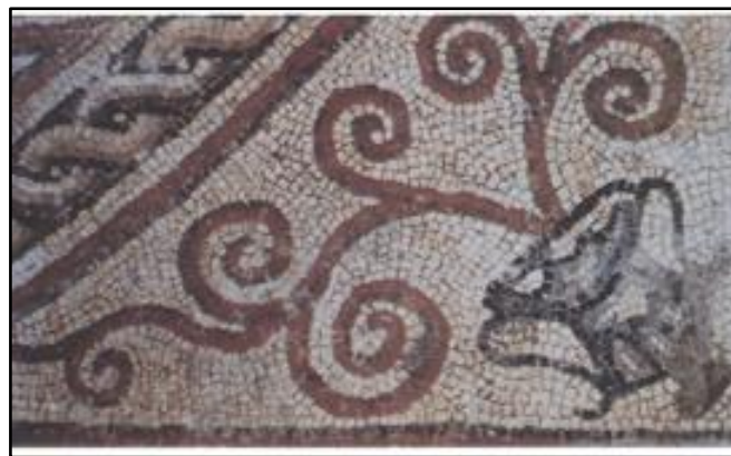
doc 4 mosaïques

- Quels matériaux constituent les tesselles ?