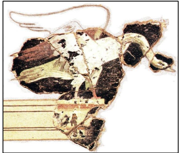
Doc 2 Peinture murale

Les peintures sur les murs et les plafonds sont répandues en Gaule, à l'époque romaine, comme un élément de confort.