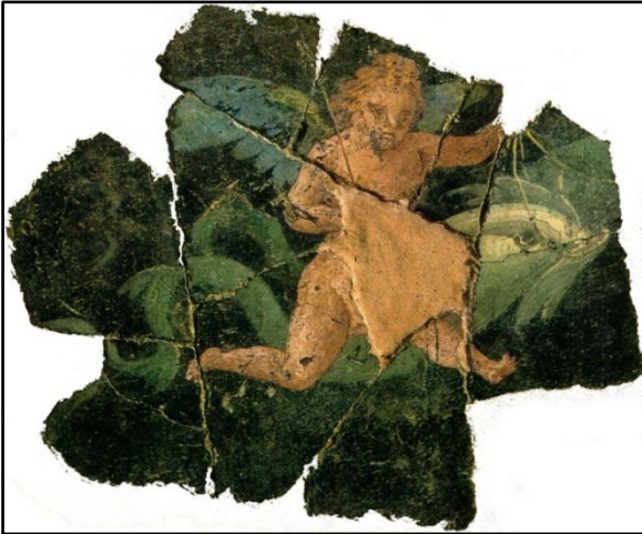
Doc 1 Peinture murale