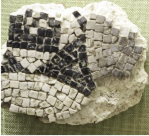
doc 3 tesselles noires et blanches